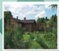
Деревья и кустарники